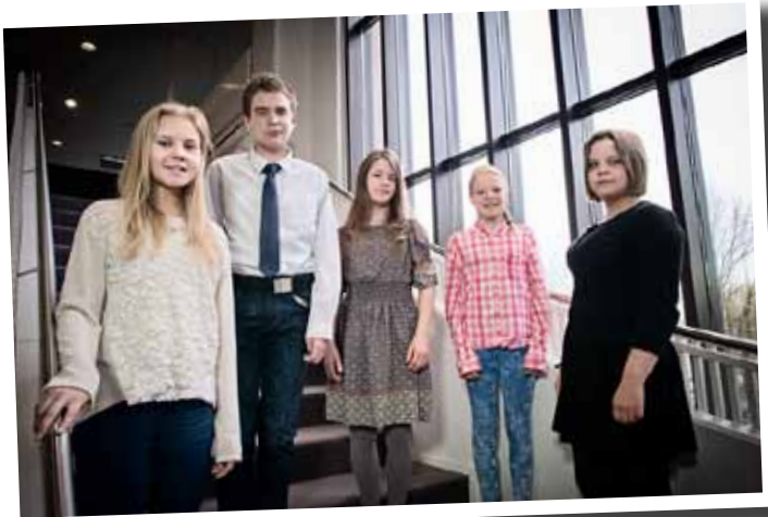
Yritys Hyvä 2014 kilpailun uuden 6.-luokkalaisten sarjan voittajia palkintojen jaossa Helsingissä 16.toukokuuta 2014.